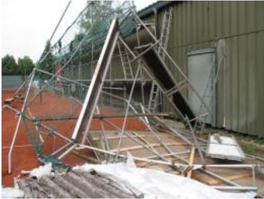
Teile des Hallendaches stürzten auf Platz 5