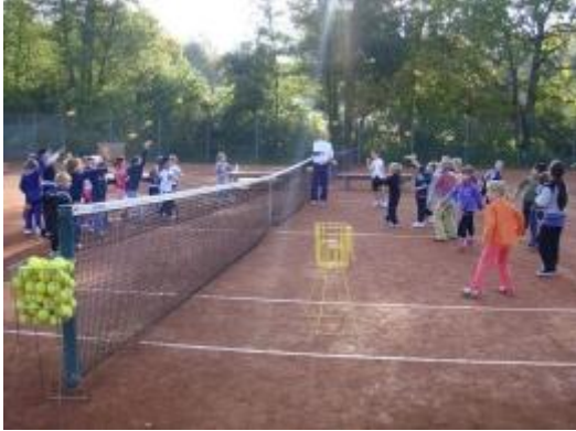
Tennisschule für Anfänger bis Könner beim TCW